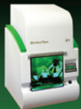
ZirkoTec® Scanner - Z1